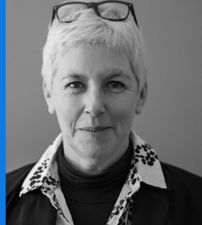
Fondatrice et Consultante en Égalité Professionnelle